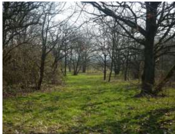
Eichen, Obstbäume, Wildwuchs / Eschig

Durch regelmäßige Mahd wird der Bewuchs, vor allem mit Brombeeren zwischen den Eichen im Norden eingedämmt.