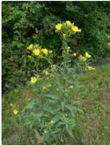
Zweijährige Nachtkerze ( Oenothera biennis )

Ab 2013 versucht der BUND Bruhrain die Eschig als ungeteiltes Offenlandbiotop in den Hardtebenen mit einer Gesamtfläche von ca. 0,4 ha vor allem von den Brombeeren zu befreien, um die Sanddüne wieder attraktiv für sonnenliebende und Sandboden bevorzugende Pflanzen und Tiere zu machen.