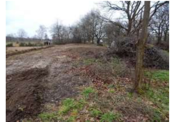
Eschig Januar 2015