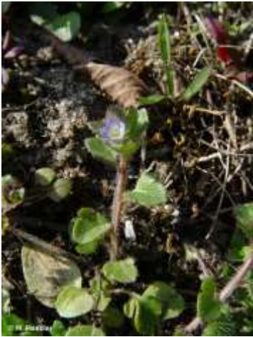
Efeublättriger Ehrenpreis ( Veronica hederifolia )

Ab 2013 versucht der BUND Bruhrain die Eschig als ungeteiltes Offenlandbiotop in den Hardtebenen mit einer Gesamtfläche von ca. 0,4 ha vor allem von den Brombeeren zu befreien, um die Sanddüne wieder attraktiv für sonnenliebende und Sandboden bevorzugende Pflanzen und Tiere zu machen.