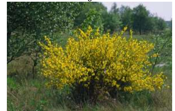
Besenginster ( Cytisus scoparius )

Ein weiterer typischer Sandflora-Vertreter ist der Gewöhnliche Besenginster.